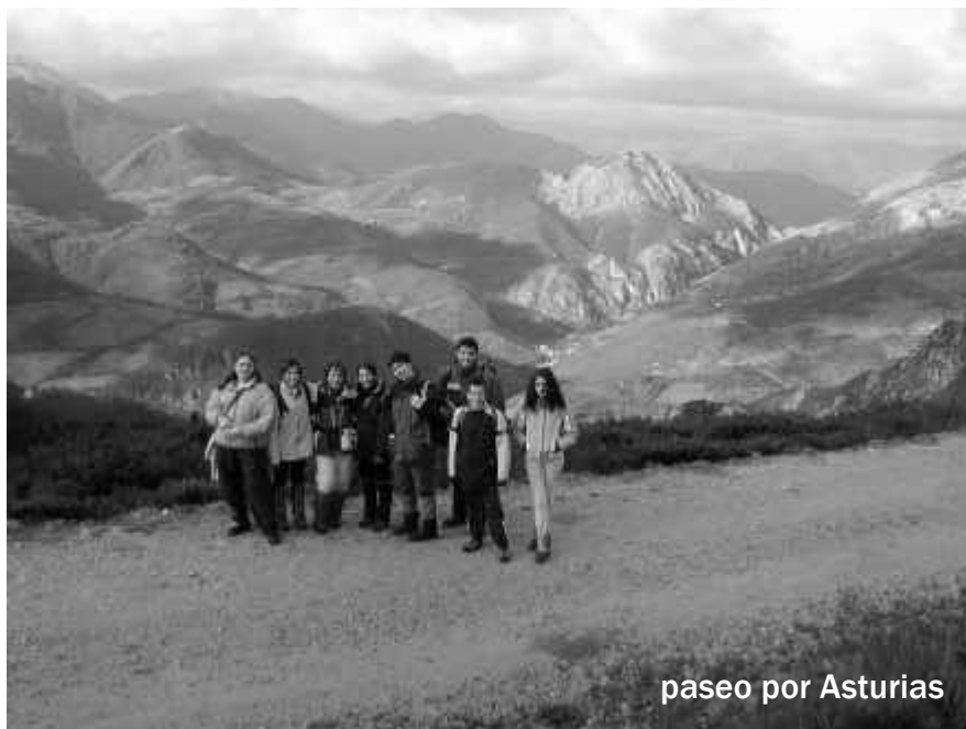
paseo por Asturias

En el siglo XI, un monje de LA RIOJA, de Cañas, cuando LA RIOJA pertenecía al estado navarro, llamado DOMINGO, creo que MANSO de apellido, se convierte en un refugiado político del rey castellano, Alfonso VI, el de LAS JURAS DE SANTA GADEA por si te suena, que es el mismo que el de los destierros de EL CID. Este rey, el castellano, no conocemos bien los motivos, aunque en la imaginación