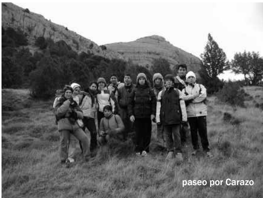
paseo por Carazo

Habrás observado que desde CALERUEGA, ¿vendrá el nombre de CALERA, es decir, del lugar donde se hace cal?, las tierras son más rojas. Son arcillas de una época en la que esta zona estaba cubierta por un gran lago que ocupaba casi toda la Comunidad y que nos indican que nos estamos acercando a la zona de los dinosaurios, a la era SECUNDARIA con sus periodos del Triásico, Jurásico y Cretácico. Por aquí, por donde pasamos, no hay indicios de dinosaurios pero detrás de la sierra de CARAZO, en el área de SALAS de los INFANTES hay numerosas muestras de esos bichos. De hecho, en Salas, hay un MUSEO muy