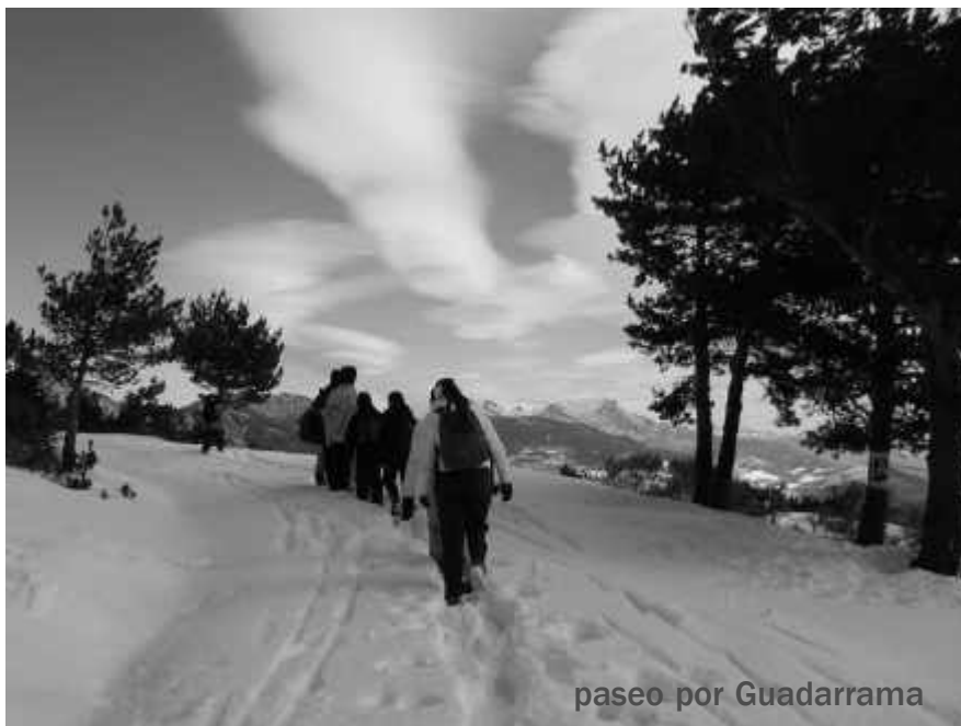
paseo por Guadarrama

ermita de san Pelayo que tiene más leyendas encima que las cumbres de CARAZO. Debajo, en su vertical, existe una cueva prehistórica LA CUEVA DE LA ERMITA habitada por homo sapiens hace