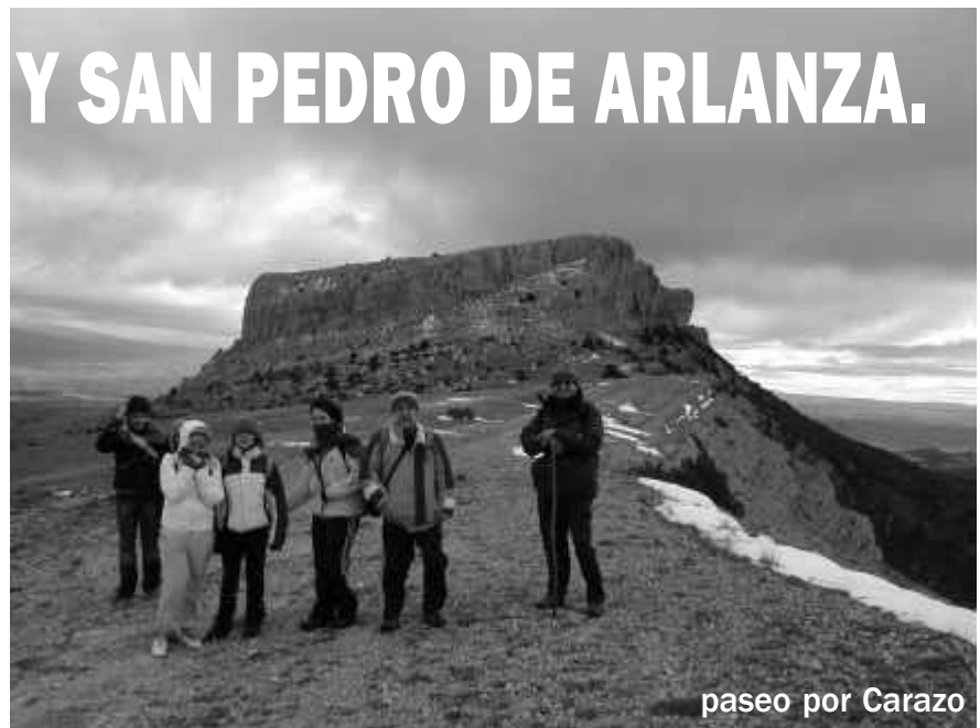
paseo por Carazo