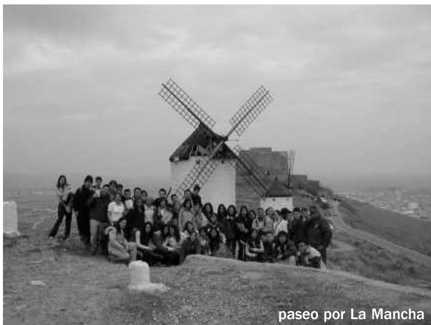
paseo por La Mancha

Te DESEAMOS, LOS REDACTORES de esta gacetilla, todo tipo de bienestar, deseando que disfrutes y conozcas cuatro o cinco cosas más de las que no sabías y la hucha de tus conocimientos aumente y los capitales que hoy pones en tu mente, digo, en tu hucha, mañana produzcan aquellos intereses que todos deseamos. Y viendo crecida la hucha y menguada tu ignorancia te sentirás más dichoso de haber aprendido.